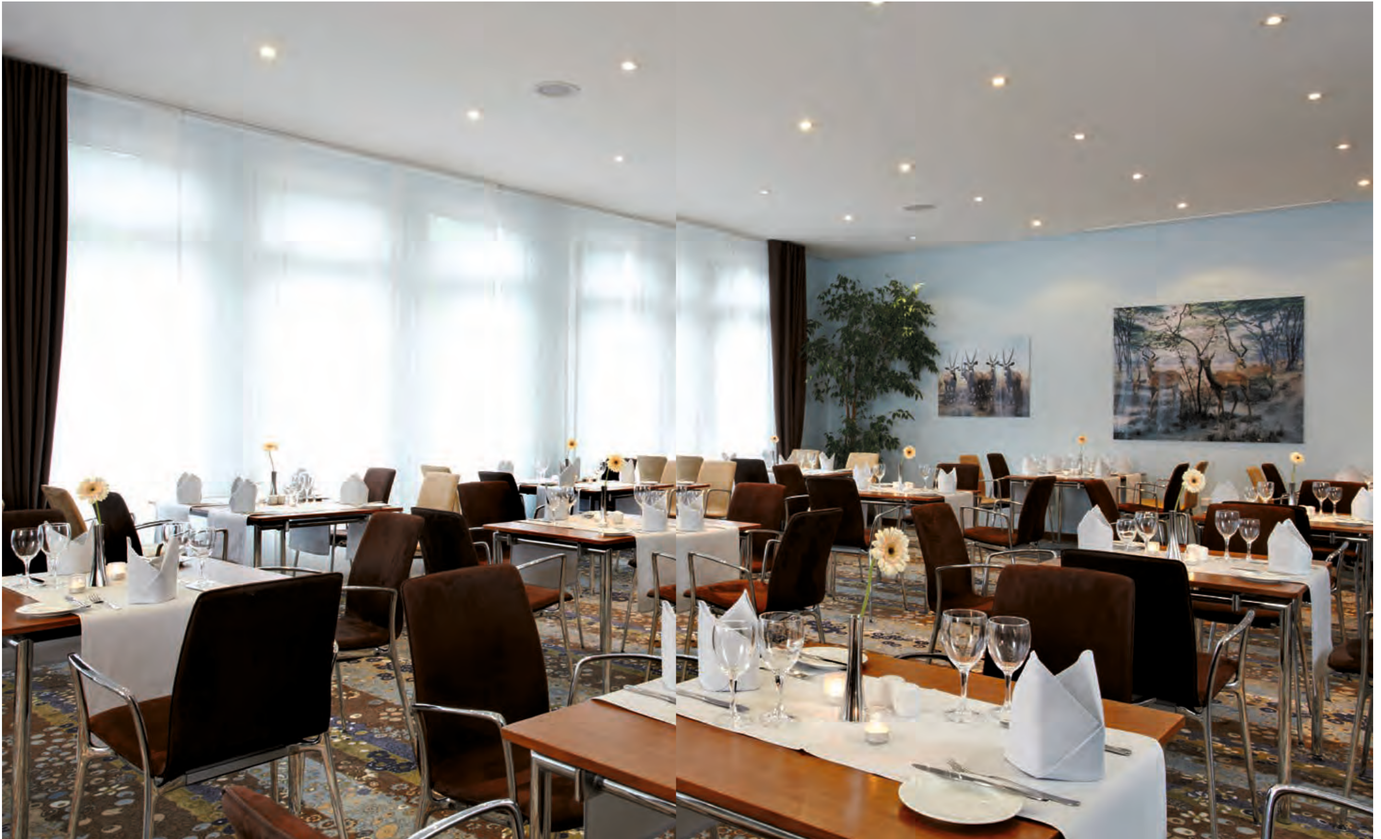
Das Team der Restaurantküche verwöhnt Sie sowohl mit typisch sächsischen als auch internationalen Spezialitäten.